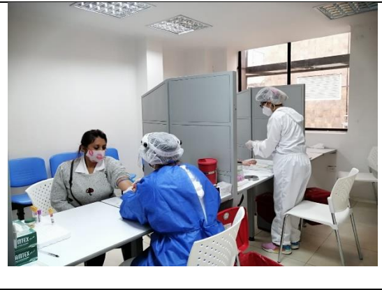
Capacitación al personal en uso adecuado de elementos de protección personal